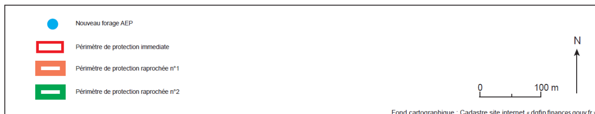
Figure 2 : délimitation des périmètres de protection rapprochées

A ce stade, seul l'inventaire des puits/forages et cuves à hydrocarbures peut être chiffré ainsi que le rebornage d'une parcelle. La mission d'inventaire est estimée à 14 000 € HT sur la base de 50 parcelles bâties et celle de rebornage à 2000 € HT, soit un total de 16 000 € HT.